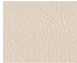
4004 - Creme

Ayurveda V has a coating specially selected by LEMI to resist oils, while maintaining the characteristics of the mattress over time.